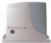
ROBUS 350 24v

cena producenta: 1780zł cena u nas: 1460zł