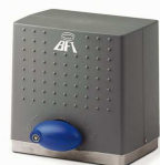
DEIMOS 300 24v

cena producenta: 2183zł cena u nas: 1850zł