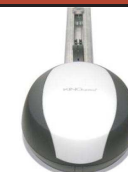
ROLLS 24v 650N

Dwa siłowniki do bram skrzydłowych o długości skrzydła do 4m. W zestawie: centrala sterująca, radioodbiornik, pilot 4-kanalowy, fotokomórka.