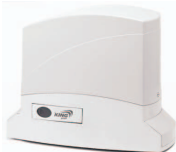
DYNAMOS 350 24v