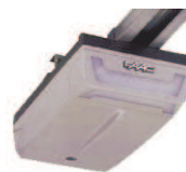
D 600 24v 600N

Dwa siłowniki do bram skrzydłowych o długości skrzydła do 3m. W zestawie: centrala sterująca, radioodbiornik, pilot 4-kanalowy, fotokomórka.